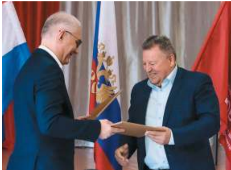
Тольяттиазот предлагает школьникам успешный карьерный маршрут – стать химиками, работать в родном городе

– Основным содержанием сотрудничества со школой №55 станет углублённая профессио-