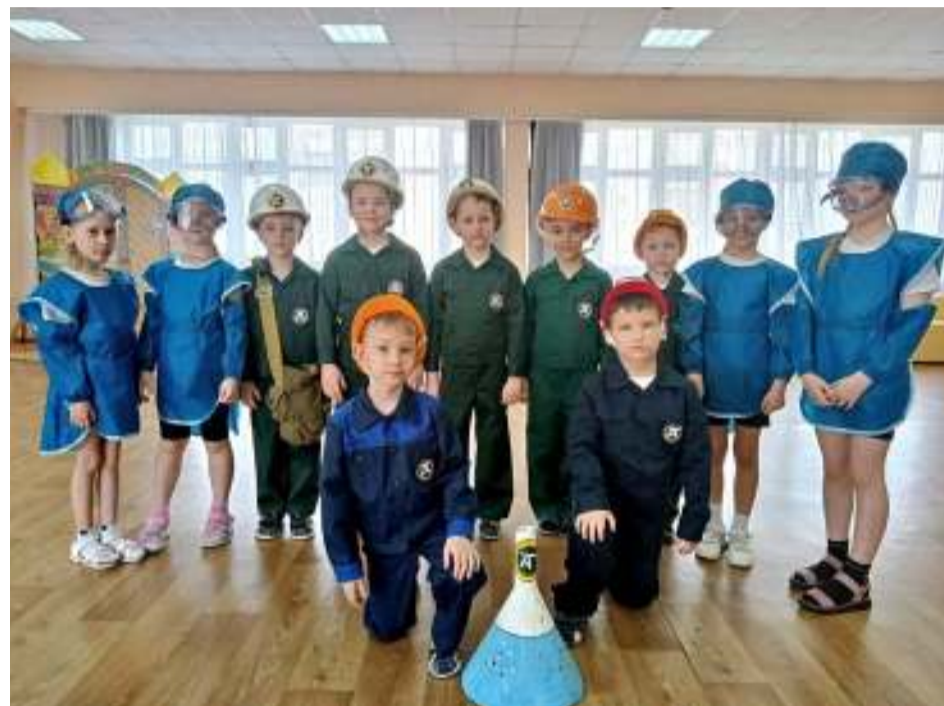
Для воспитанников детского сада «Тюльпан» главная профессия в Тольятти – химик